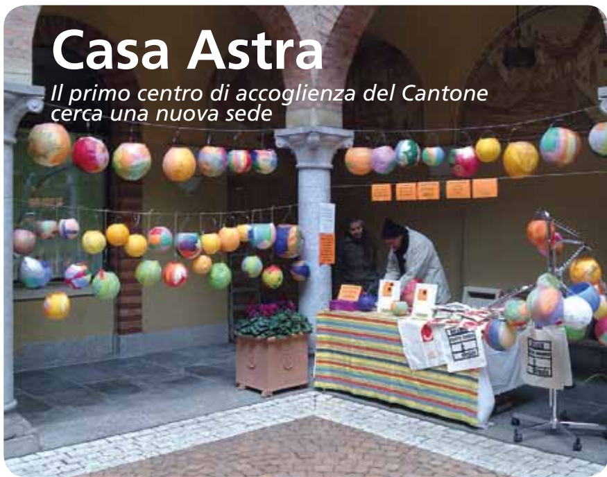
Lanterne fabbricate dagli ospiti di Casa Astra al mercatino natalizio di Bellinzona, 13.12.2009

Il primo maggio del 2004 ha inizio l'esperienza di Casa Astra, il primo centro di accoglienza per senza fissa dimora in Ticino. Il Movimento dei Senza Voce , l'associazione che se ne prende cura, apre l'appartamento di Ligornetto e inizia, in forma completamente volontaria, ad accogliere tutti coloro che, per diversi motivi, si trovano a non avere un tetto o a vivere in una situazione abitativa talmente precaria e insalubre per cui il centro di accoglienza è l'unica soluzione prima della strada.